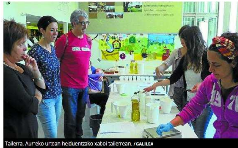
Tallerra. Aurreko urtean helduentzako xaboi tallerrean.